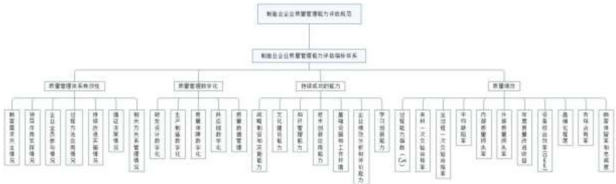
图1 制造业企业质量管理能力评估指标体系