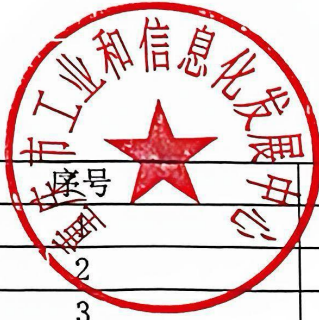
合同价格明细表 (单位: 元)