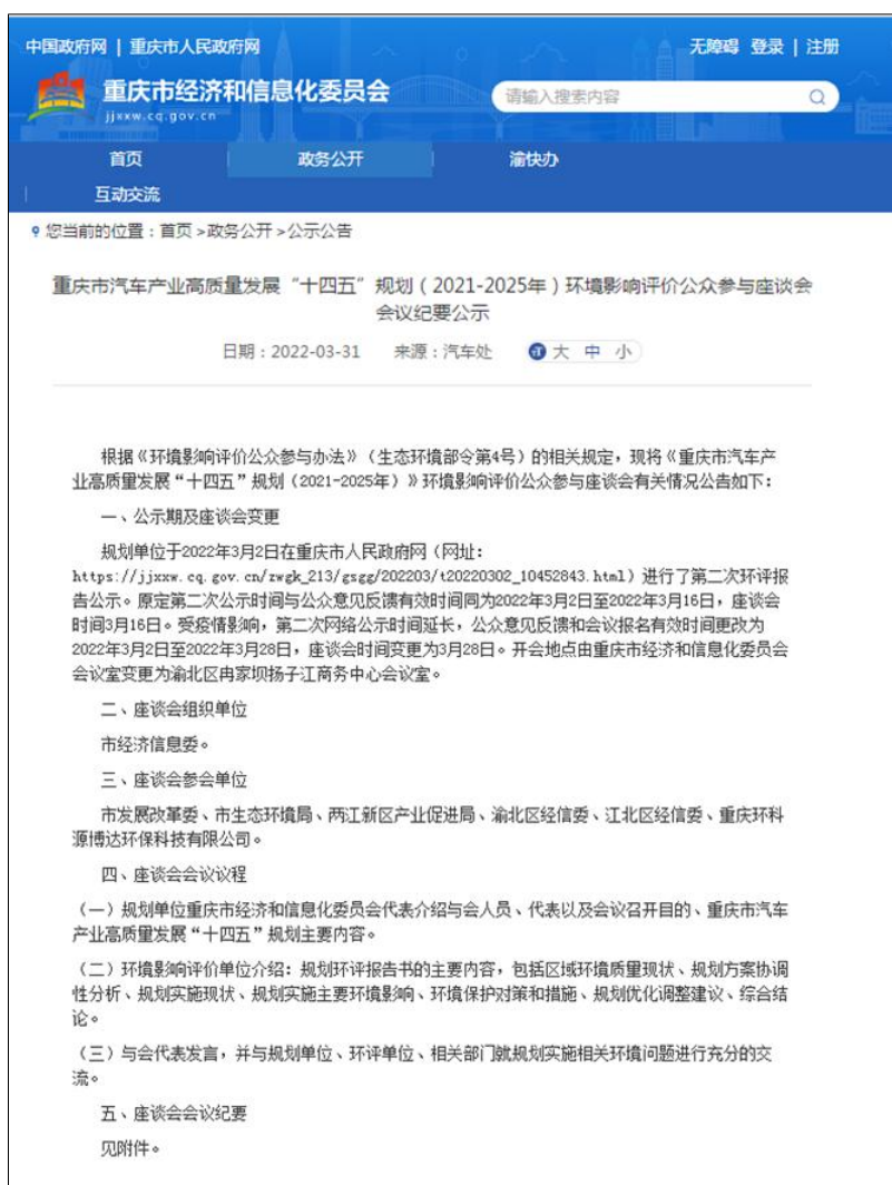
图 4-1 第二次网上公示时间变更及座谈会会议纪要公示

公参座谈会后，于 3 月 31 日公示了会议纪要，同时对第二次网上公示时间变更进行了解释说明。