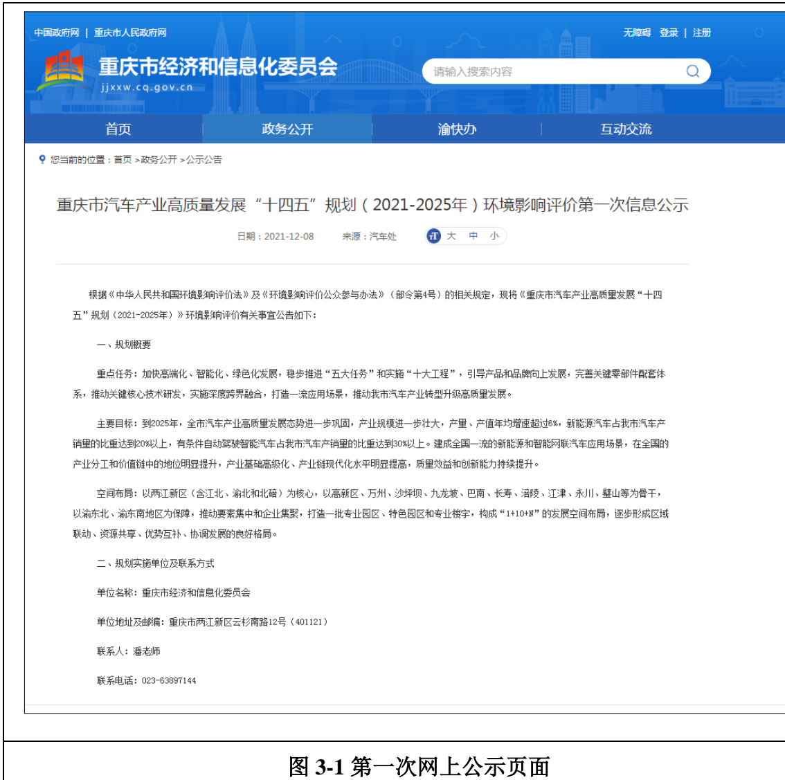
图 3-1 第一次网上公示页面

10452843.html，见图 3-1。为更好的征集公众意见，本次公示期最终延长至 2022 年 3 月 28 日，延长说明在网站上进行了公示，见图 3-4。